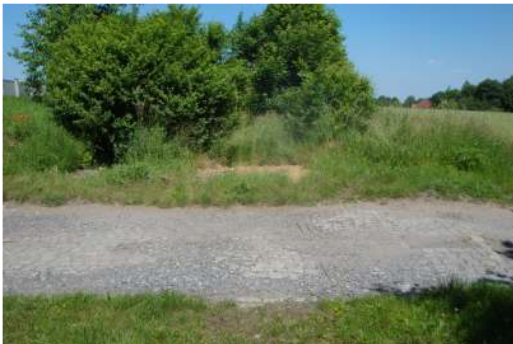
Widok na odcinek w stronę dworca Sukowice