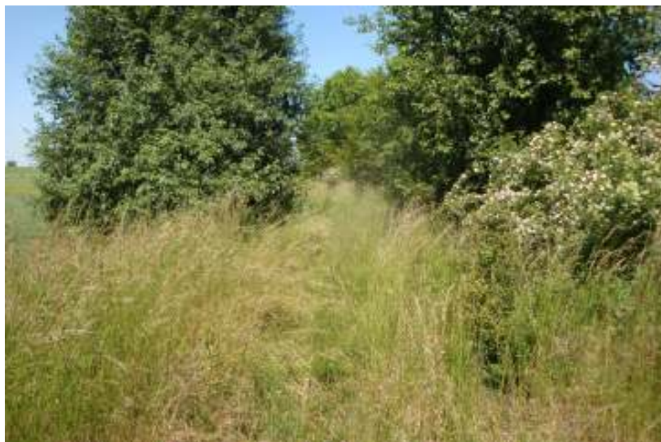
Widok odcinka pomiędzy granicą z Gminą Reńska Wieś , a ul. Sukowicką

Dokumentacja zdjęciowa stanu istniejącego odcinka obejmującego tereny w Gminie Cisek przedstawiona została poniżej.