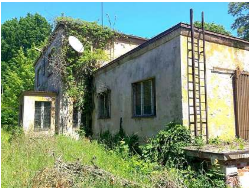
Budynek dworca Sukowice