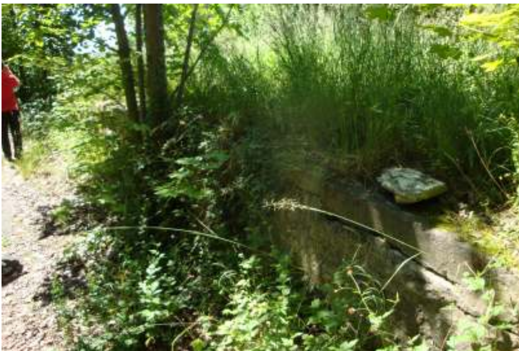
Widok rampy na terenie dworca