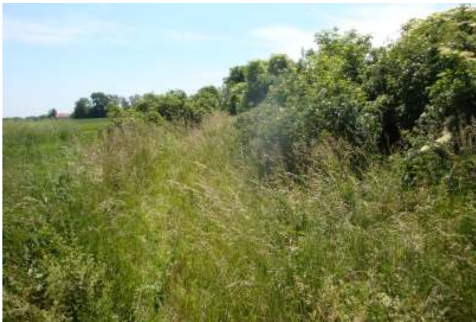
Widok odcinka pomiędzy granicą z Gminą Reńska Wieś , a ul. Sukowicką